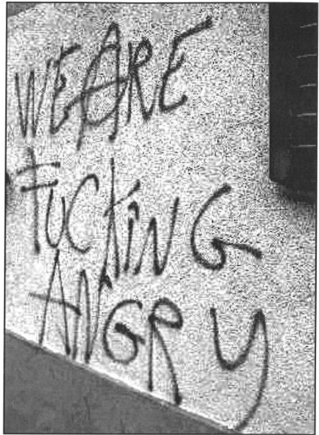
Eine der vielen Nachrichten, die an dem Krawall vom Dezember 2014 auf den Wänden hinterlassen wurde.

Doch auch diese Äusserungen des sozialen Konfliktes wurden mittlerweile von den staatlichen Institutionen längst wieder eingebunden, während die kapitalistische Verwaltung des städtischen Raumes weiter voranschritt. Heute ist die Repression zweifellos, nach wie vor, das endgültige Mittel, worauf der Staat sich stützt, um die bestehenden Verhältnisse von sozialer Trennung und Ausbeutung zu wahren. Aber abgesehen davon, dass ihre Formen sich verändert haben, sind weitere Massnahmen hinzugekommen, ausgefeiltere und besser für das demokratische Modell geeignete, die vielmehr auf die präventive Sicherstellung der sozialen Befriedigung und des Konsenses abzielen: einerseits durch eine immer eindringlichere Suche nach Partizipation, andererseits durch eine immer detailliertere Kontrolle des sozialen Raumes. Denn, wo sich die kapitalistische Wertproduktion nicht mehr in par-