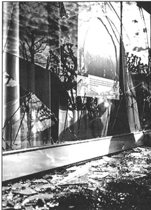
Eine der mindestens hundert Vitrienen der Stadt der Reichen, die in jener Nacht ihren werbenden Glanz verloren.

Mit einem voraussichtlichen Wachstum von über 60'000 Bewohnern, das bis 2025 erwartet wird, soll die Stadt sich allmählich in eine „multipolare“ Metropole verwandeln, mit den drei Zentren Innenstadt, Altstetten und Oerlikon, während die Schlafghettos am Rande der Stadt und in den Vorstädten, vor allem in Richtung Norden und Westen, weiter ausgebaut werden. In diesem Sinne werden einerseits, auf dem nutzlos gewordenen Raum der alten Industriegebiete, neue Luxusquartiere und Bürokomplexe aus dem Boden gestampft, wie in Zürich West, Altstetten und Zürich Nord, und andererseits bestehende Wohnquartiere allmählich „aufgewertet“ und erneuert, wie im Langstrassenquartier, an der Weststrasse, künftig im Hardquartier und im Zentrum von Altstetten. Mit einer Betonung des Kleingewerbes und ökologischen Bauten wird versucht, diese „Aufwertung“ gegenüber den Bürgern in ein positives Licht zu rücken, um zu verbergen, was dies für den Grossteil ihrer jetzigen Bewohner bedeutet und bedeuten wird: die Destination für jene, die wirtschaftlich uninteressant sind oder dem Bild einer „international wettbewerbsfähigen Stadt“ nicht entsprechen, wird, über kurz oder lang, die