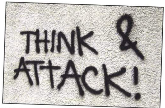
Ein Spray nach dem Massenangriff auf die Europaallee

Der Krawall vom 12. Dezember 2014 hat uns allen gezeigt, welches Potenzial in Individuen steckt, die sich entscheiden, zu revoltieren. Wenn es uns gelingt, dieses Potenzial in einen bewussten, fortwährenden aufständischen Kampf zu verwandeln, gestützt auf selbstverwaltete Strukturen, die auch fähig sein können, sich untereinander zu koordinieren, bleibt es der Fantasie eines jeden überlassen, welche Möglichkeiten dies uns eröffnen könnte, um gegen die erstickenden Projekte der Regierenden vorzugehen und die Freiheit, den Raum und die Zeit, die uns täglich entrissen werden, zurückzuerobern.